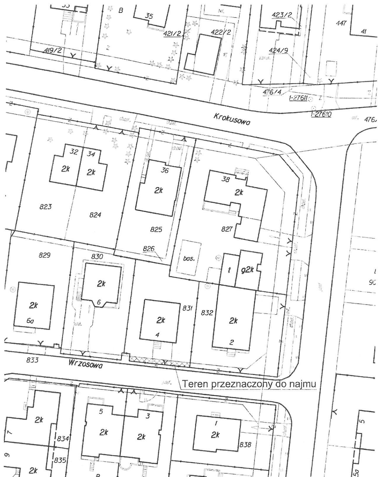
Załącznik Nr 4 do Uchwały Rady Miasta Rzeszowa z dnia Nr LXXVI/1669/2023 z dnia 28 marca 2023r.